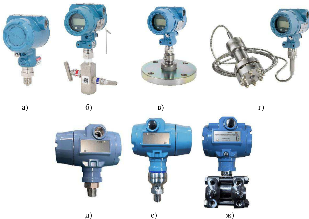
Рисунок 1 – Общий вид датчиков давления Метран-75 а), д), е) - датчики штуцерного исполнения; б) датчик в сборе с клапанным блоком; в) датчик в сборе с выносной разделительной мембраной прямого монтажа; г) датчик в сборе с выносной разделительной мембраной, соединенной капилляром, ж) датчик фланцевого исполнения